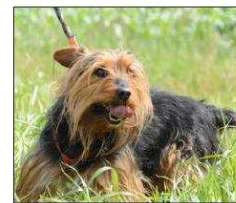
Gatsby attend sa nouvelle famille.

L'adoption est un acte responsable, qui doit être réfléchi et accepté de tous les membres de la famille. Si vous avez un chien, venez avec lui au refuge pour faire