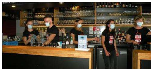
À l'aide d'une carte, il sera possible de remplir son verre à l'une des 12 tireuses disponibles.